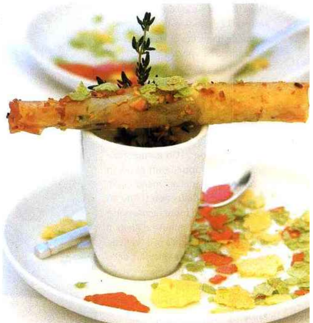
Courgette en tempura...

• L'Atelier 7 rue des Carmes 13200 Arles Tél. 04 90 91 07 69.