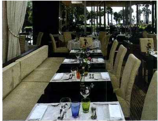
Nouvelle déco tendance au Park 45 du Grand Hôtel de Cannes

car ses créations inédites sont servies en petites et grandes portions, comme la salade Les