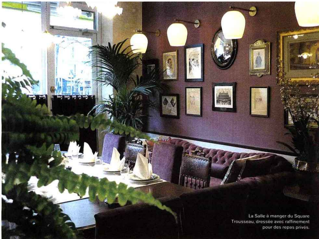
La Salle à manger du Square Trousseau, dressée avec raffinement pour des repas privés.