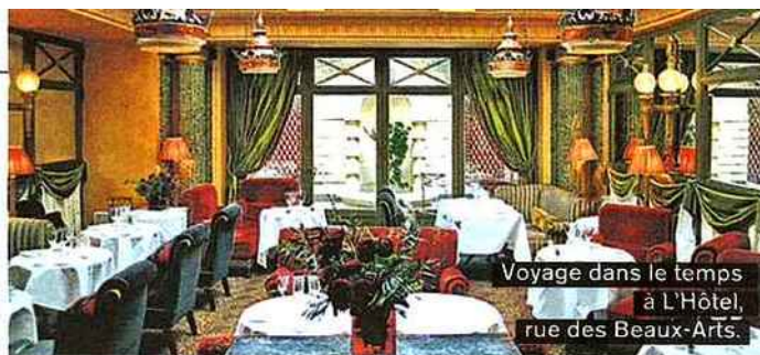
Voyage dans le temps à L'Hôtel, rue des Beaux-Arts.