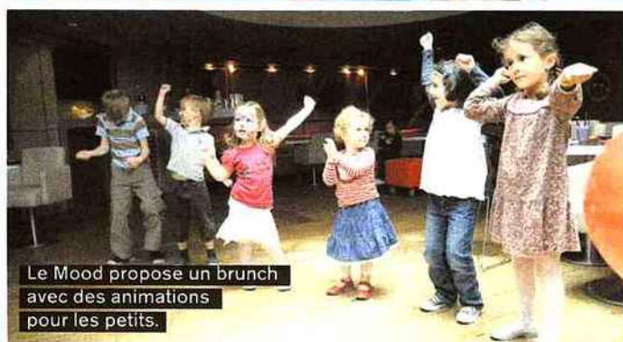
Le Mood propose un brunch avec des animations pour les petits.