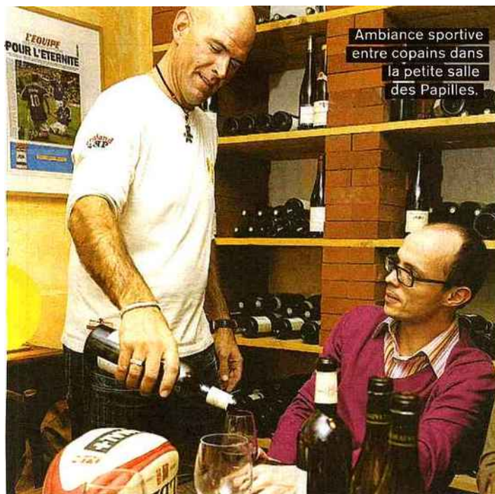
Ambiance sportive entre copains dans la petite salle des Papilles.