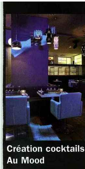
Création cocktails Au Mood